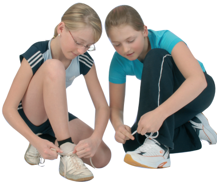
Ideal für den Sportunterricht: Universal-Hallen-Sportschuh (Schulsportschuh)

Sportschuhe, die man im Sportunterricht in der Halle trägt, sollen nicht auf der Straße getragen werden. Sie bringen sonst Schmutz in die Sporthalle, erhöhen dadurch das Unfallrisiko (Rutschgefahr) und die Gefahr der Verbreitung von Krankheitserregern. Wird der Hallensportschuh im Freien benützt, ist vor der weiteren Nutzung in der Sporthalle eine gründliche Reinigung des Schuhs erforderlich.