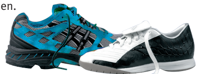
Joggingschuh / Universal-Hallen-Sportschuh

Man sollte sich beim Kauf also gut beraten lassen und die Möglichkeit nutzen, qualitativ hochwertige Auslaufmodelle preisgünstig zu erwerben.